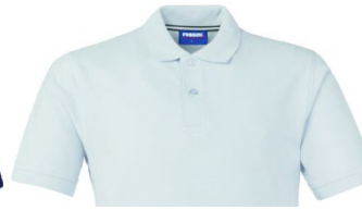
02 – WHITE