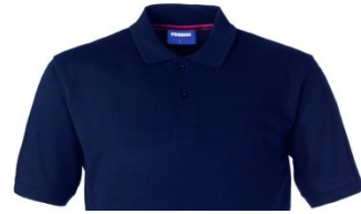
01 – BLU