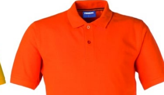
09 – ORANGE