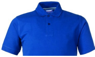
06 – ALBASTRU REGAL