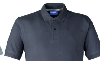
16 – ANTRACITE