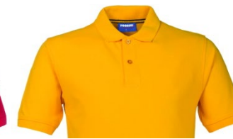
08 – GIALLO