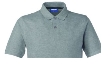
12 – GRIGIO MELANGE