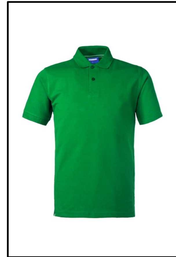
04 – VERDE