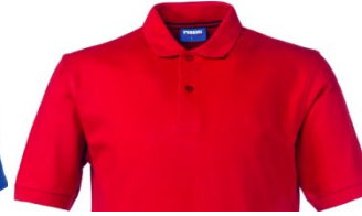
07 – ROSSO