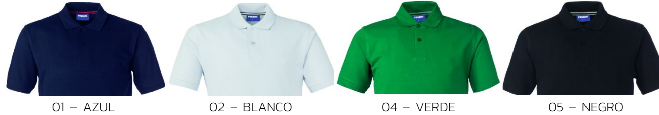
01 – AZUL