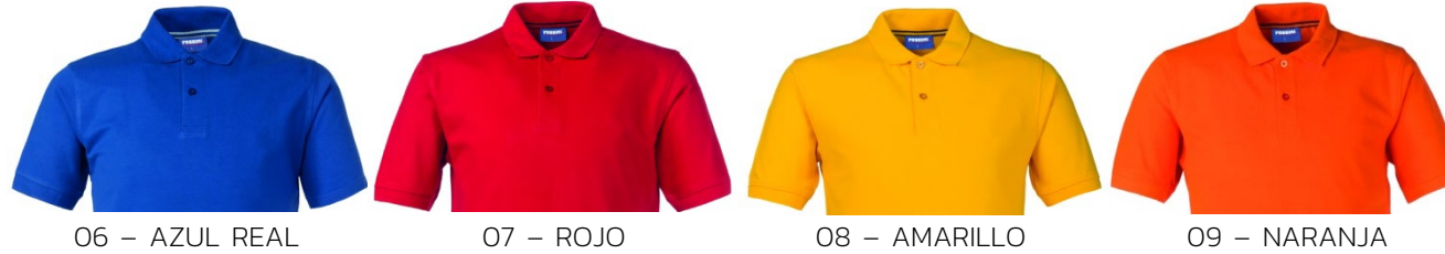
06 – AZUL REAL

Polo de manga corta con tira para el sudor de color en contraste en la parte posterior del cuello, cuello cerrado con dos botones, circunferencia de la manga acanalada, aberturas laterales en contraste en la parte inferior.