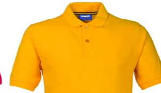
08 – YELLOW