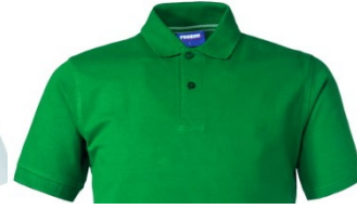
04 – VERDE