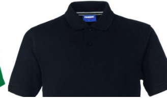
05 – NERO