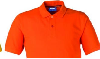
09 – PORTOCALIU