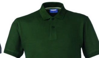
51 – BOTTLE GREEN